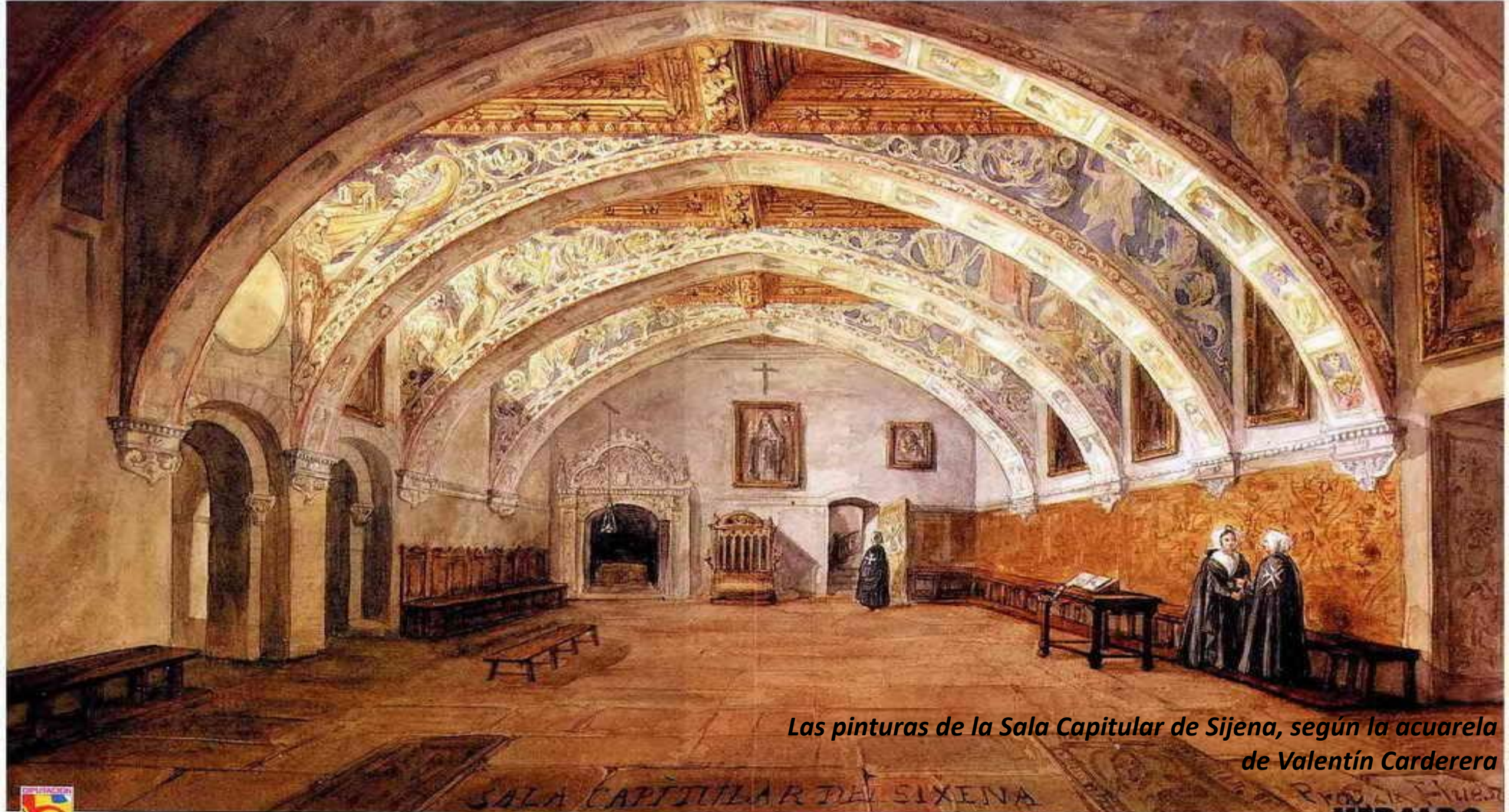
Las pinturas de la Sala Capitular de Sigüenza, según la acuarela de Valentín Carderera

Sala Capitular del Monasterio de Sigüenza, según la acuarela de Valentín Carderera (1796-1880). Colección Duquesa de Villabermosa.