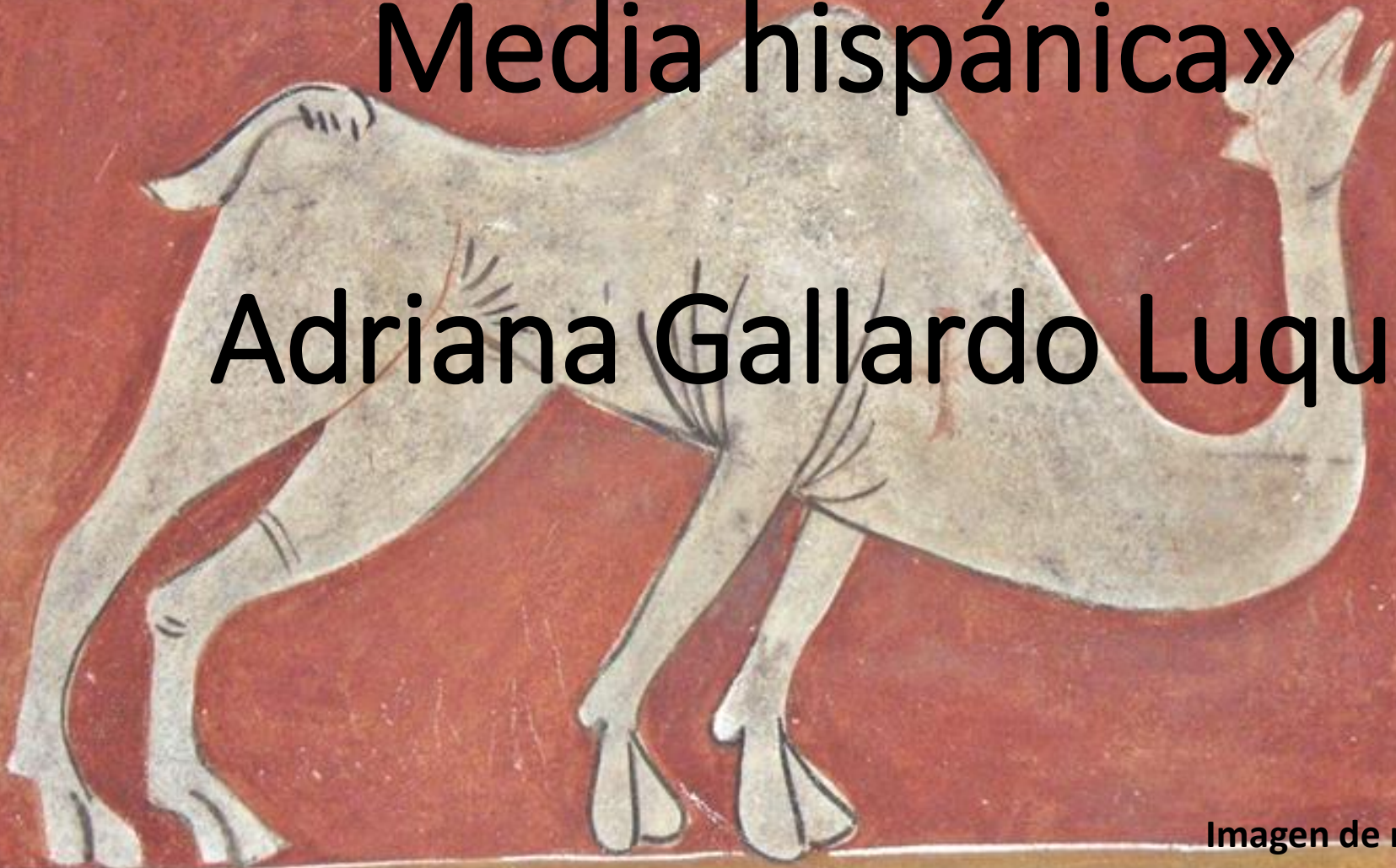
Imagen de marca de agua: Camello de las pinturas de la Iglesia del Valle del Bohí