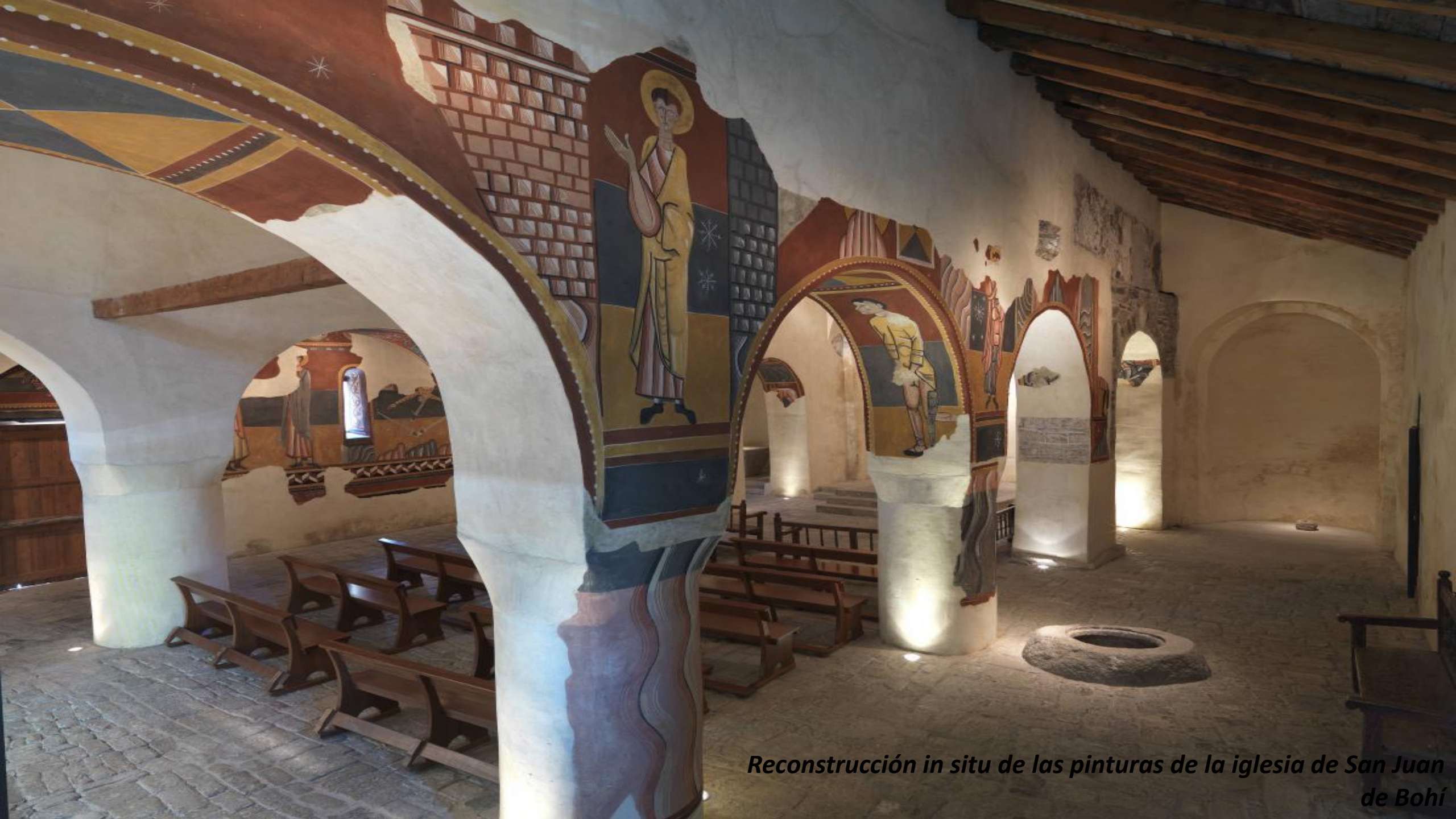
Reconstrucción in situ de las pinturas de la iglesia de San Juan de Bohí