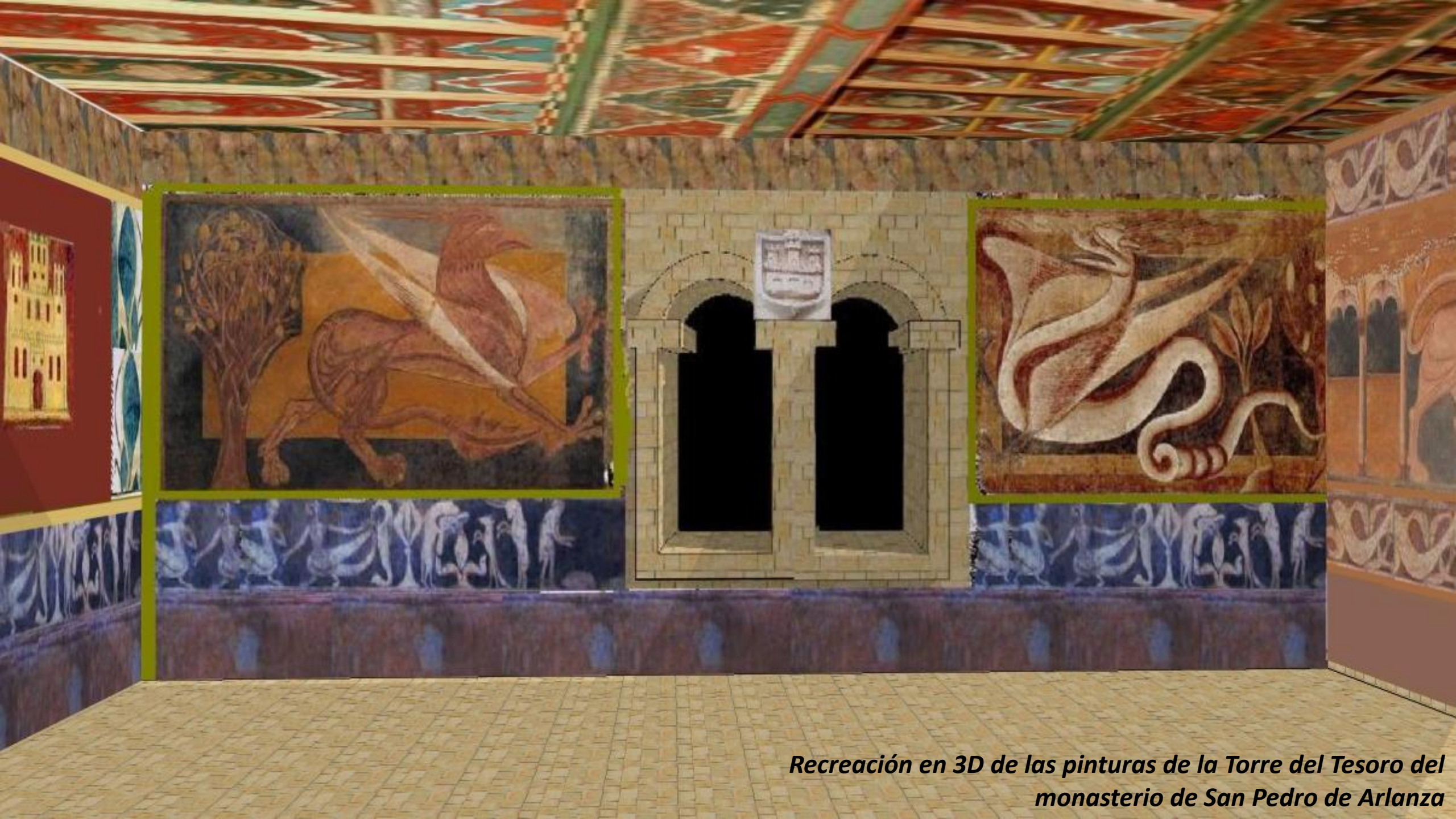
Recreación en 3D de las pinturas de la Torre del Tesoro del monasterio de San Pedro de Arlanza